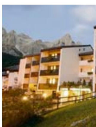
Il residence «Lastei»

Giugno e luglio sulle Dolomiti trentine a «prezzi low cost» ospiti dei complessi della Residencehotels ( www.residencehotel.it ). Prenotando entro il 12 maggio di possono trascorrere soggiorni al «Lastei» di San Martino di Castrozza (dal 21 giugno al 12 luglio) a 18 euro al giorno a persona in appartamento arredato. Dal 5 al 12 luglio al «Garni Aritz» di Campitello di Fassa 36 euro a testa in mezza pensione.