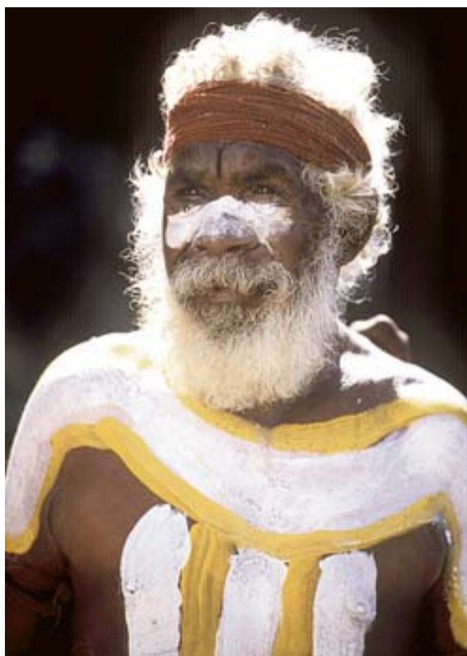
Un aborigeno: nell'Uluru National Park molti di loro fanno i ranger

UNO SPETTACOLO UNICO , soprattutto se ammirato dal cielo a bordo di un aereo, o giungendo nelle prime ore del mattino in sella a un Harley Davidson oppure sul dorso di cammelli, pronipoti di quelli che furono condotti in Australia dall'Afghanistan per completa-