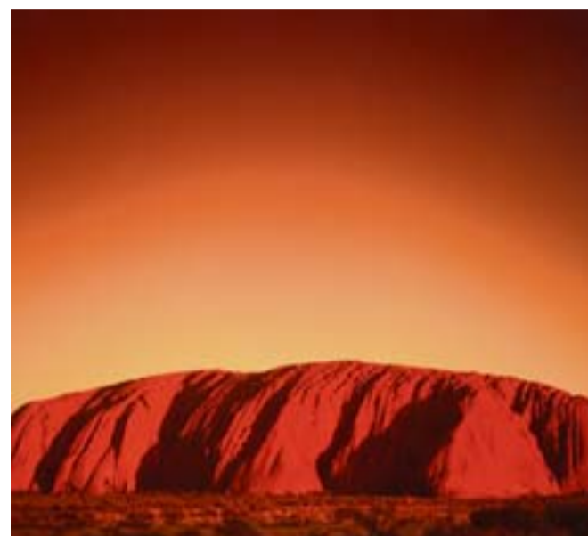
Il monolito d'arenaria dell'Ayers Rock al sorgere del sole

Ayers Rock, si innalzano i monti Olgas, chiamati Kata Tjuta dagli aborigeni che venerano queste 36 grandi rocce color rosso bruno dalle bizzarre forme e «comignoli» aguzzi, disseminati su una superficie di circa 3.500 ettari, tanto che alcuni siti, per la gelosia dei nativi, sono vietati all'ingresso dei non-iniziati. È comunque possibile camminare lungo alcuni sentieri che penetrano il cuore degli Olgas, ammirare la vegetazione, gli eucalipti che spuntano tra gli anfratti di roccia e gli uccelli variopinti lungo la Valley of the Winds, e Olga Gorge. ♦